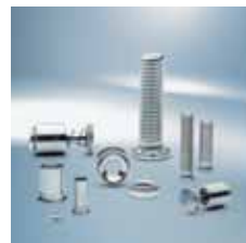
› Lisovací prvky Self-clinching fasteners