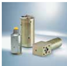
› Zesilovače tlaku Pressure intensifiers