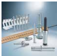
› Trhací nýty Blind rivet technology