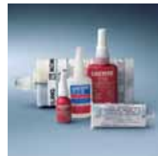
› Lepidla a tmely Adhesives and sealants