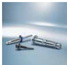
› Upevňovací prvky pro stavebnictví 1) Construction fasteners 1)