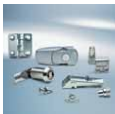
› Řešení pro kontrolu přístupu Access solutions