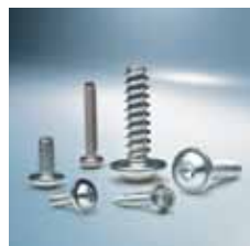
› Šroubové spoje Screw technology