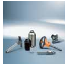
› Rychlouvrešovací čepy a pružinové písky Quick release pins and spring plungers