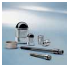
› KOENIG-EXPANDER® Zátky KOENIG-EXPANDER® Plugs