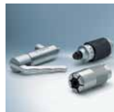
› Rychloadaptéry a rychlospojky 1) Quick connectors 1)

1) Není dostupné v České republice | Not available in Czech Republic