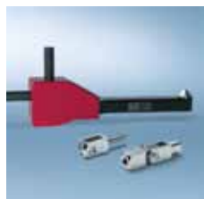
› Speciální prvky Special processes