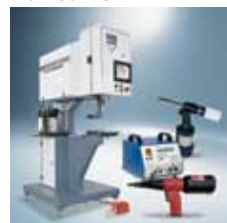
› Montážní technika Installation technology