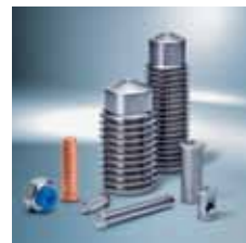
› Systémy pro navařování kolíků | Stud welding systems