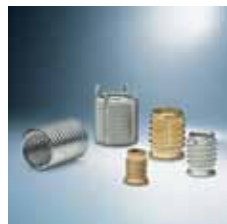
› Závitové vložky Thread inserts