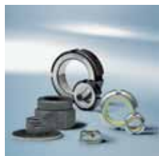
› Pojistné matice Lock nuts