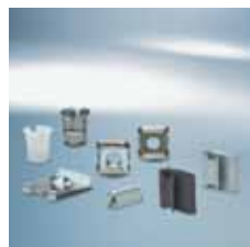
› Rychloupínací prvky a spony | Quick fastening elements and clips