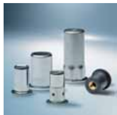
› Nýtovací matice Blind rivet nuts