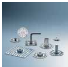
› Lepicí spojovací prvky Bonding fasteners